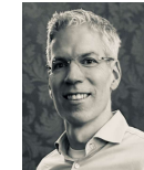
PD B. Habermann